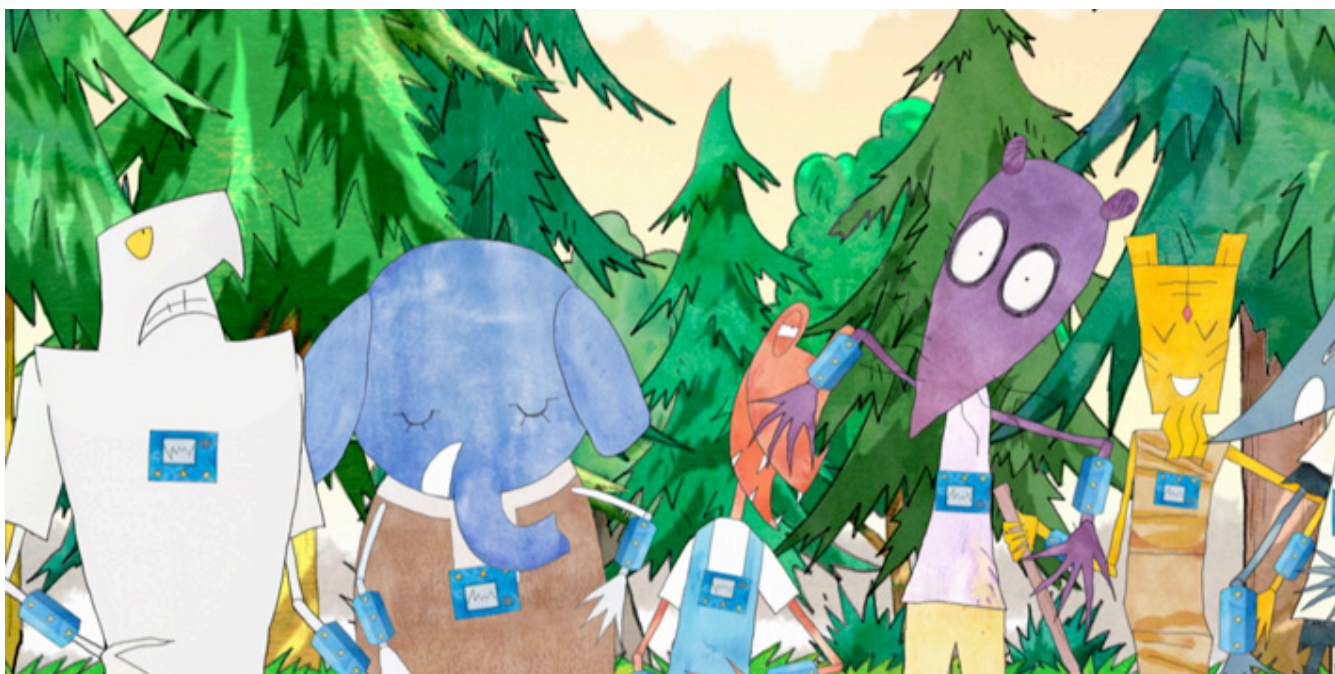
(第1話 エレガントな発電より)